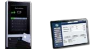
OSD-BDE Betriebsdaten- Erfassung