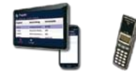
OSD-MTS Mobile Time Solution